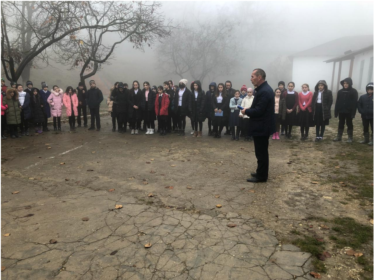
Построение после эвакуации