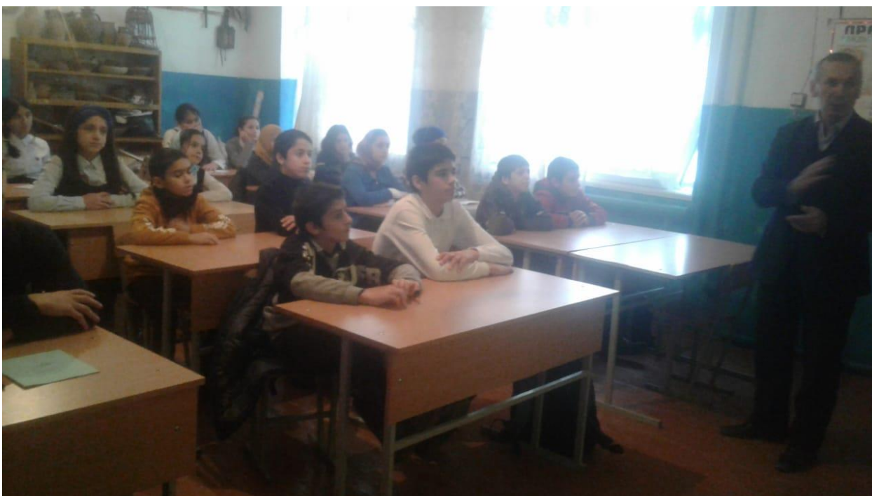
Учебный фильм по ПБ.